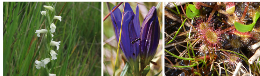
Spiranthe d'été, Gentiane pneumonanthe et Drosera

2 Regagner le point de départ en empruntant dans le sens inverse le chemin qui longe la RD 461. > Jonction avec le tour du marais du Cassan, balisé en vert.