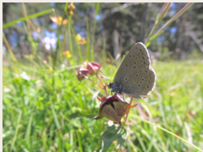
Azuré des mouillères

Au mois d'août, lors des quelques semaines de leur vie d'adulte, les Azurés des mouillères volent en hâte au-dessus des zones humides, car ils doivent se reproduire et pondre leurs œufs, sur la Gentiane pneumonanthe. Une fois écloses, les chenilles se nourrissent de cette plante. Ensuite, tombées au sol, elles vont émettre des phéromones, imitant celles des fourmis de la famille des Myrmicas. Ces dernières vont recueillir la chenille et la nourrir jusqu'à l'été prochain, où elle se transformera en papillon. Ainsi, les Azurés des mouillères ont besoin de zones humides en bon état, accueillant des Gentianes