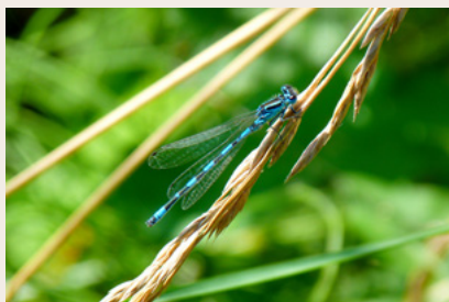
Agriçon de Mercure

Plus de la moitié du site est concerné par l'activité agricole, principalement tournée vers l'élevage bovin. Environ un tiers du site est boisé, le reste est partagé entre milieux naturels en cours de boisement et zones urbanisés.